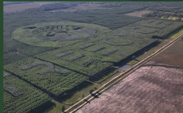
Weltrekord – Naturlogo

Der Tag startet mit der Präsentation und auf dem Grundstück von TREECYCLE I – dort wächst das grösste Naturlogo der Welt – ein Meer aus Eukalyptus, das dich staunen lässt. In Vista Alegre geniesst du ein entspanntes Mittagessen – danach Wanderungen Entspannen im Pool. Am Abend öffnen die Menschen der Kolonie Independencia ihre Türen, ein lebendiger Einblick in Tradition und Gemeinschaft. Und vor dem gemeinsamen Abendessen wird noch ein spannendes Hausprojekt gezeigt.