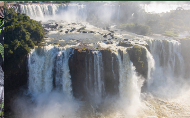
Foz do Iguazú